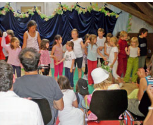
Kinderzirkus Toggo Schlussaufführung