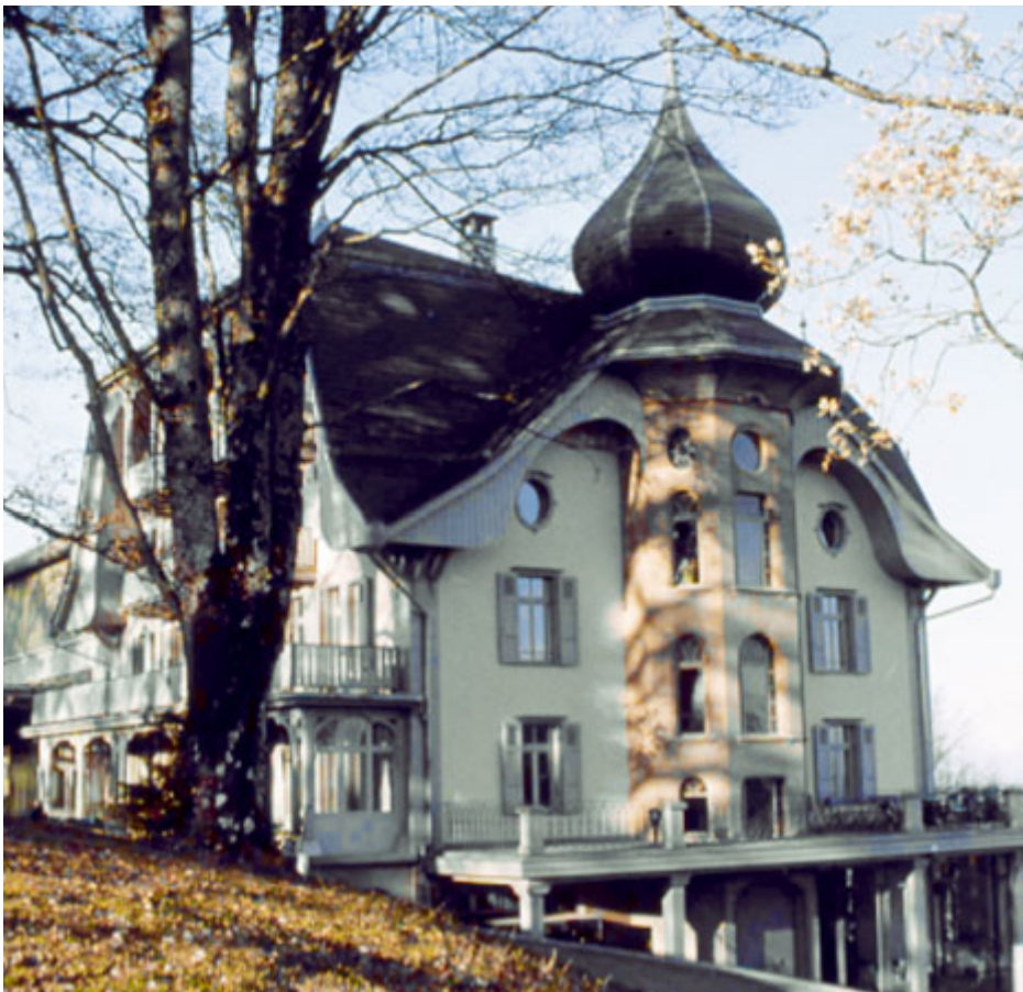
Das Hotel auf dem Gurten 2004