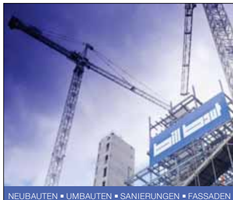
NEUBAUTEN • UMBAUTEN • SANIERUNGEN • FASSADEN