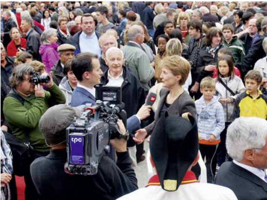
39 437 Menschen wohnen in Köniz, darunter auch eine Bundesrätin.