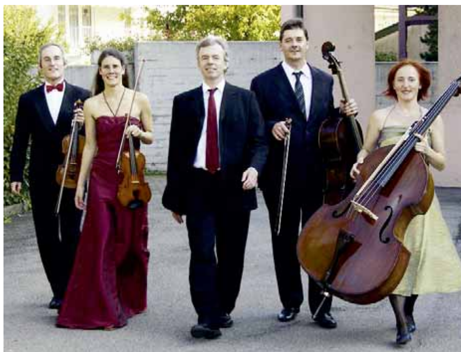
I Galanti, Klassikformation mit Waberer Beteiligung.

Reservation: 033 345 02 06 oder klassik@bernau.ch