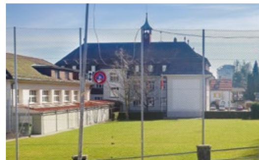
Rasenplatz und hoher Zaun / Ballfang entlang der Dorfstrasse werden bald weichen.

«Zündhölzli» heisst das Siegerprojekt des Gesamtleistungswettbewerbs für die Erweiterung der Schulanlage Wabern Dorf. Da die Schülerzahlen in Wabern stark steigen und auf der Primarstufe sowie in der Tagesschule zunehmend Platznot herrscht, eilt es: Bereits aufs Schuljahr 2020/21 hin soll das neue Gebäude bezogen werden.