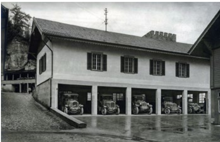
Ansicht Gebäude 12, LKW-Garage und Lagergebäude um 1928 und 2017.

Das Gebäude 12 wurde damals als Garage für die Bierlieferungswagen benutzt. Im Obergeschoss wurden unter anderem Buffets und Festmobiliar gelagert.