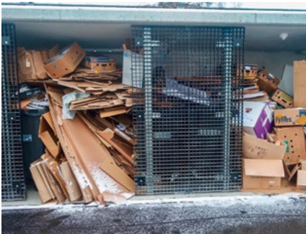
Züglete an den Nesslerenweg hinterlässt Spuren.