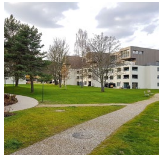
Vorher – nachher: bauliche Verdichtung um 70%, und trotzdem attraktivere Aussenräume als zuvor.