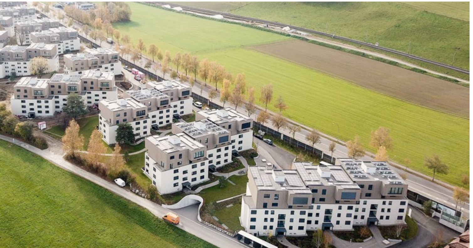
Überbauung Nessleren als Bindeglied zwischen Wabern und Kehrsatz. Rechts im Bild zwischen Seftigenstrasse und Bahnlinie die Balsigermatte – heute Landwirtschaftszone, künftig regionaler Entwicklungsschwerpunkt mit ÖV-Knoten Bahn/Tram/Bus?