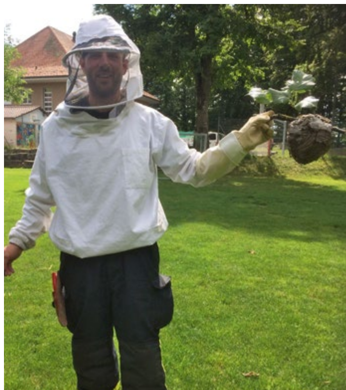
Die Feuerwehr Köniz bekämpft nicht nur Brände, sie entfernt auch Wespennester. Dieses Jahr waren es besonders viele.

Vor einigen Jahren konnten wir noch mit einem tieferen Faktor arbeiten. Damals war es für viele Feuerwehrleute noch einfacher, im Ernstfall ihren Arbeitsort verlassen zu können. Dies ist unter anderem auf die damaligen Erwerbstätigkeiten und Arbeitsorte zurückzuführen. Erfreulicherweise blieb unser Bestand nach zuvor jahrelangem leichtem Rückgang