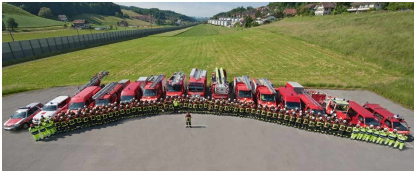
Die Gesamtformation der Feuerwehr Köniz.

Damit wir die Vorgaben bezüglich am Einsatzort zur Verfügung stehender Feuerwehrleute erfüllen können, muss das Aufgebot tagsüber seit Jahren kontinuierlich erhöht werden. Derzeit bieten wir tagsüber mit Faktor fünf auf, d. h. um beispielsweise eine geforderte Personalstärke von zehn Feuer-