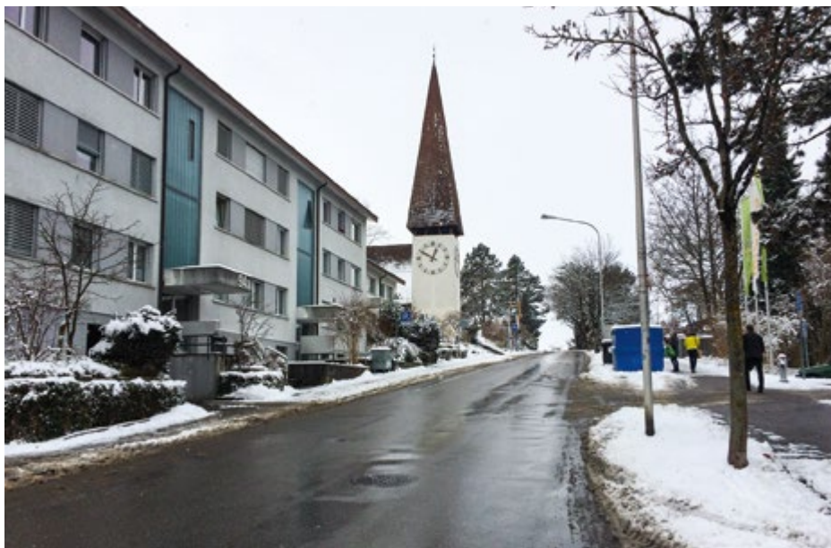
Spiegel im Blickwinkel

Im Spiegel leben aktuell 4572 Personen. Die ältesten Bewohner haben noch vor Ende des ersten Weltkrieges das Licht der Welt erblickt, im aktuellen Jahr kamen 32 Erdenbürger dazu. Im Jahr 2018 dürften im Spiegel vermehrt die Korken knallen: der grösste im Spiegel vertretene Jahrgang sind die 1968er – knapp 100 Personen werden also nächstes Jahr einen runden Geburtstag feiern. Von den Einwohnern sind 800 unter 18 Jahre alt und von ihnen besuchen 500 die Schule Spiegel. An der Schule gibt es 24 Klassen, 78 Mitarbeitende und seit 2009 gehört auch eine Tagesschule zum Angebot der Schule. Diese wird regelmässig von 190 Kindern besucht.