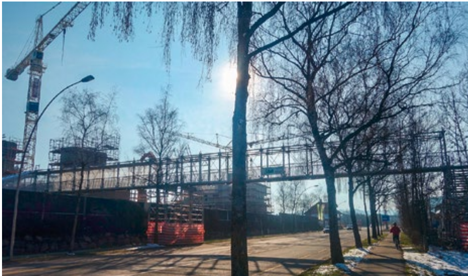
Grossbaustelle am Nesslerenweg und Passerelle über die Seftigenstrasse sind passé.