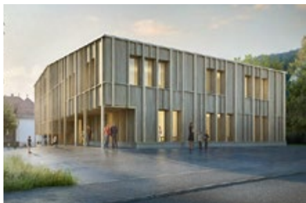
Holzbauweise war im Wettbewerb gefordert. «Zündhölzli» als weitere Hommage an Mani Matter in Wabern.

Dass mit dem Juryentscheid dasselbe Team zum Handkuss kommt wie bei der Erweiterung der Schulanlage Hessgut, sei Zufall – oder eben nicht, wie die Vertreter der Jury an der Medienorientierung betonten: Offenbar leiste dieses Team hervorragende Arbeit.