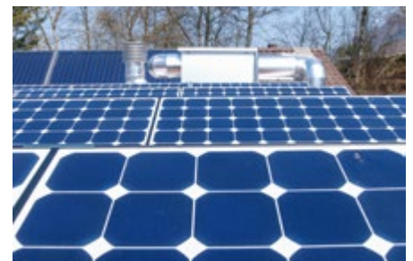
Solaranlagen auf dem Minergie-Pfadiheim Büschi

Nachdem im November 2018 aus geologischen Gründen der Bohrabbruch für die Erdsonden für die neue Wärmepumpenheizung der Büschiheime notwendig wurde, wird zurzeit eine Luft-Wasser-Wärmepumpe mit intelligenter Steuerung erstellt. Das bedeutet: Ab Mitte Juni 2019 wird für alle vier Könizer Pfadiheime die Heizung und das Warmwasser mit erneuerbarer Energie erzeugt.