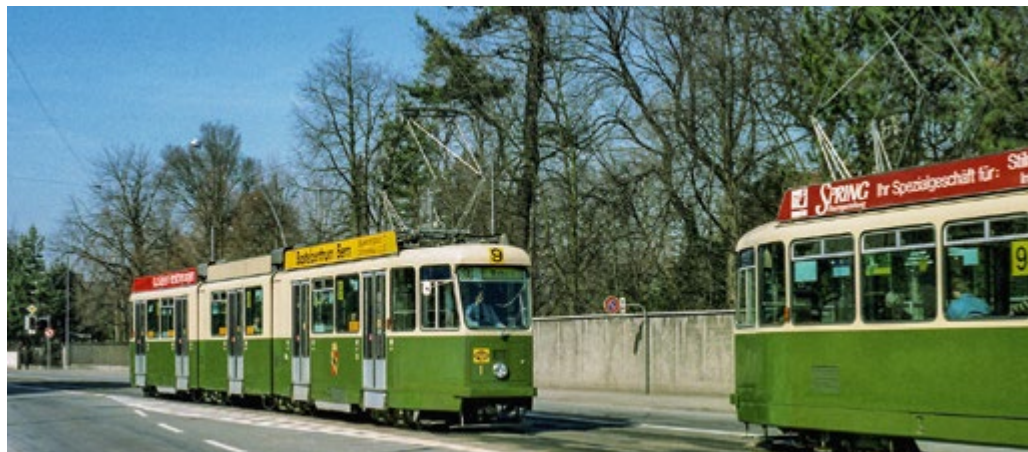
Begegnung zweier Doppelgelenkmotorwagen mit Baujahr 1973 bei der Villa Bernau, noch vor dem Umbau der Seftigenstrasse, mit Tram-Eigentrassée in der Strassenmitte.