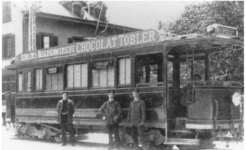
Einer der ersten elektrischen Tram-Motorwagen an der Endstation Wabern im Sommerhalbjahr 1902. Links im Hintergrund das heute noch bestehende Haus Seftigenstrasse 222.