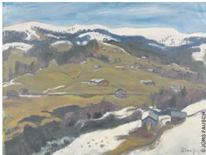
Fred Stauffer, Lauener Landschaft, 1940, Öl auf Leinwand, 110.5x114 cm; Museum zu Allerheiligen Schaffhausen