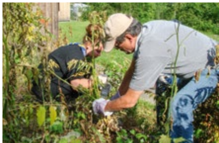
Essigbaum im Büschi bekämpfen

Die Pfadi wollen die Natur nutzen, was auch eine Verpflichtung ist, sie zu schützen. Dies soll nicht mit Verboten erreicht werden, sondern durch Vermittlung von Kenntnissen, so zum Beispiel beim Feuermachen, ohne Bäume zu beeinträchtigen.