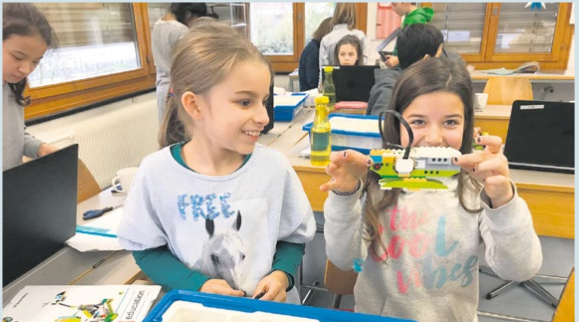
Die Könizer Schulen legen grossen Wert auf eine solide und praxisnahe Grundausbildung im Fachbereich Medien und Informatik.

Der Vorsteher der Direktion Bildung und Soziales über das neue Schulfach Medien und Informatik.