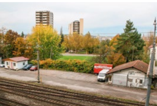
Blick vom Areal Gurtenbrauerei auf die Baulücke zwischen Bahnlinie und Kirchstrasse Bild Gemeinde Köniz