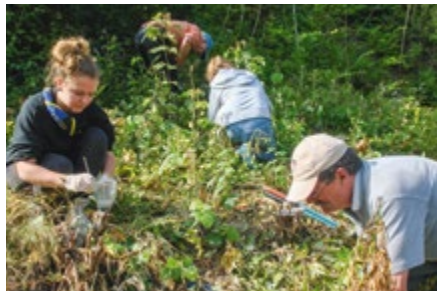
Berufkraut, ein invasiver Neophyt

weil sie die Solaranlagen beschatteten. Nach dem Fällen erschienen Wurzeltriebe in grosser Anzahl, auch mehrere Meter vom Stamm entfernt. Bis 2015 breitete sich der Essigbaum bereits auf über 25 Quadratmeter aus. Drei Jahre lang bekämpften Heimvereinsleute unterstützt von Pios den Essigbaum gezielt mit Erfolg: Schon letztes Jahr war das nicht mehr nötig.