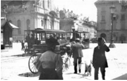
Ende des vorletzten Jahrhunderts: Ein Dampfzug aus der Länggasse wendet am Bahnhofplatz, um anschliessend nach Wabern zu fahren